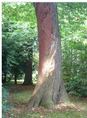
, 24 Août 2005

XLSX (Excel 2007) - XLS (Excel 1997-2003) .